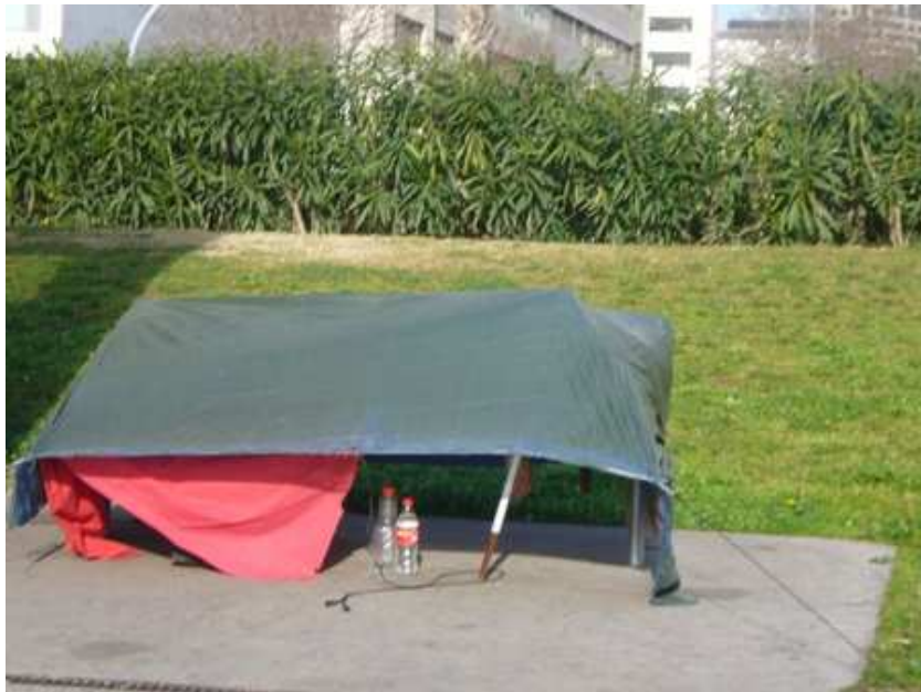
Schlafstelle nahe Strand