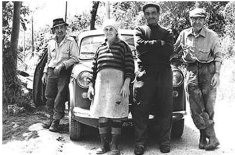
Ausflüge nach :Ascea-Velia und Castellabate

Die Besuche in den nächstgelegenen Städten haben das noch bestätigt.