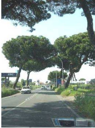
Schnappschuss aus dem Auto. Auf der Fahrt nach Rom

konnten wir einfach nicht am Wochenmarkt in Cassino vorbeifahren. Da wir rechtzeitig ankamen, sind wir auch noch hoch zum Kloster Monte Cassino