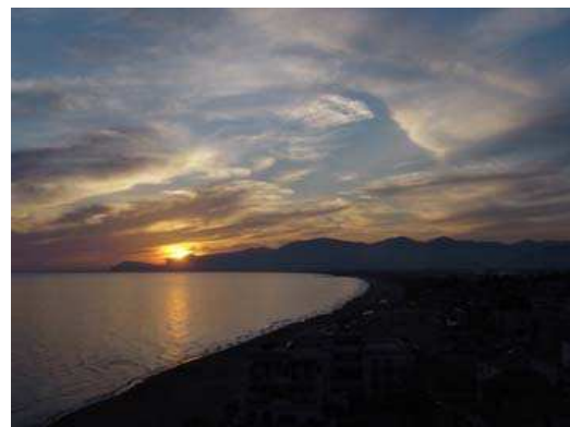
Abschied aus Sperlonga