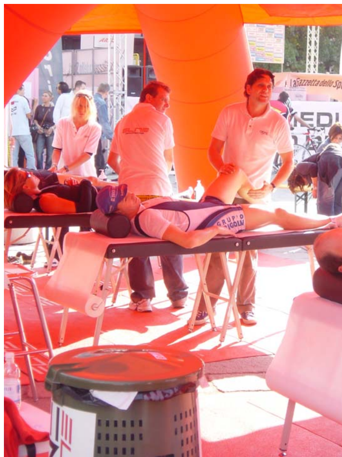
Radler nach einer Bergfahrt und unsere Beine hätten auch eine Massage verdient

Am vorletzten Tag haben wir noch einen Tag in Pavia verbracht. Eine altherwürdige Uni-Stadt mit vielen jungen Menschen.