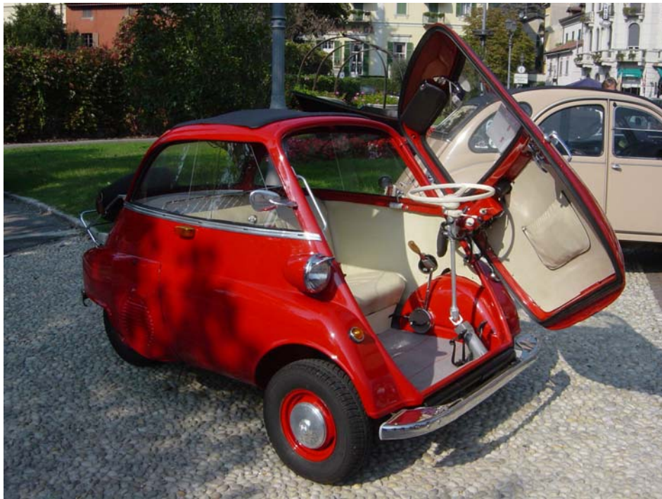
Oldie-Treffen am Comer See