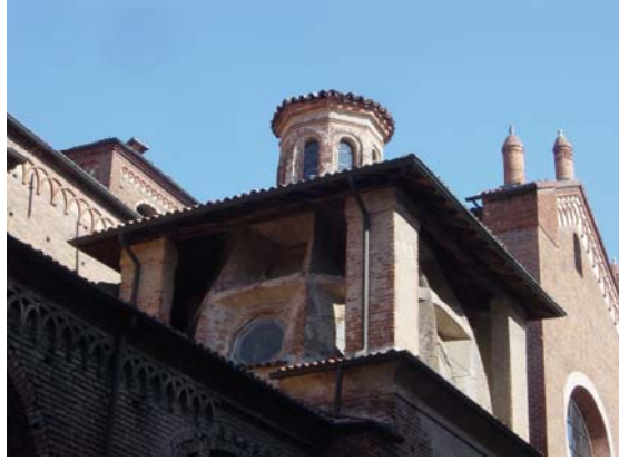
Weitere Fotos aus Milano: