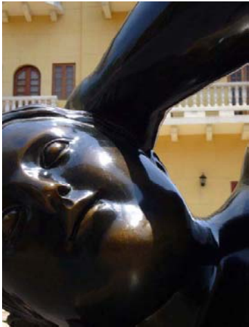
Detail Skulptur von Botero