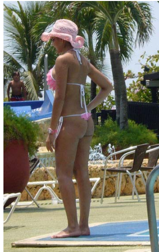
Eindrücke aus Cartagena

Plätzen und nicht so viel Militär wie an den hiesigen Stränden. Noch etwas fiel uns auf, die Schönheitschirurgen haben in Kolumbien bestimmt gut zu tun wenn man so die vielen stolz gezeigten Busen ansieht.