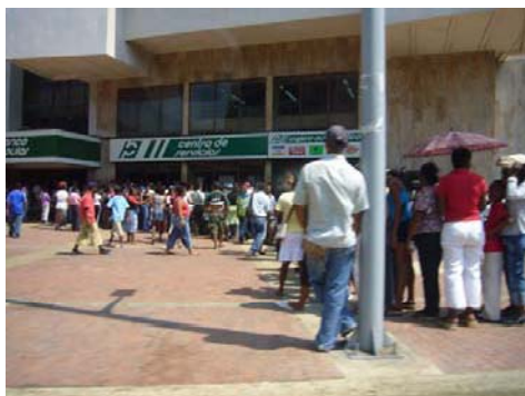
Arm und reich