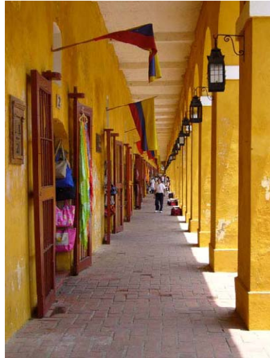
Shoppingcenter im ehemaligen Gefängnis / Fensterblick