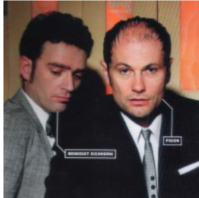
Pigor und Begleitung

Die gemeinsame Zug-Rückfahrt nach Berlin mit 11:00-Uhr- Berentzen-Käse-Wildsalami-Pause war ganz kurzweilig. Das Mehringhof-Theater mit