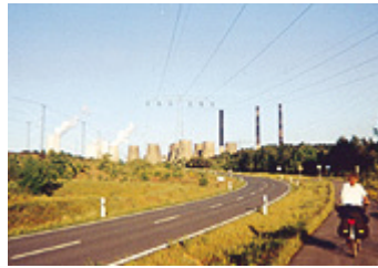
das Kraftwerk im Hintergrund